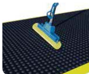
Regelmäßig feuchtes abwischen der Oberfläche